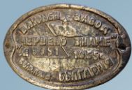
Табелка на 6051-ят вагон, произведен в завода през 1955 г.

След завършване формата на обучение в катедра „Железопътна техника и технологии“ към Факултета по транспорт в Технически Университет – София, може да се реализирате в следните работни позиции: